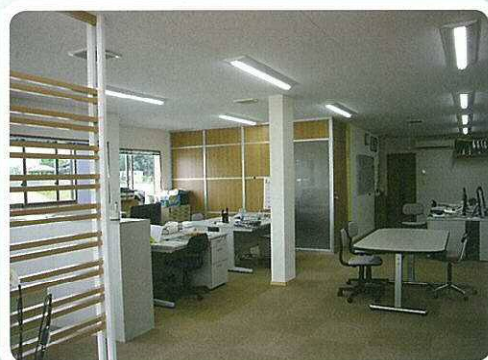
●デザイン部 ●営業推進部